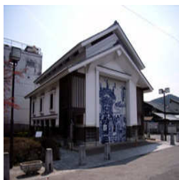
【仲町屋台展示収蔵庫】