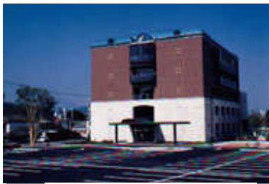
【市民情報センター】