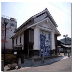
【仲町屋台展示収蔵庫】