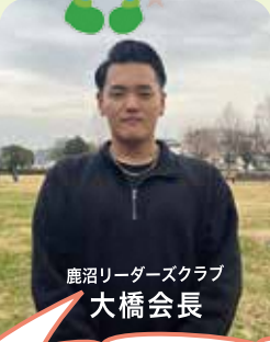
鹿沼リーダーズクラブ 大橋会長