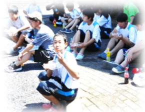
▲田植え後の軽食タイム 地域の方手作りの赤飯を皆でいただきました