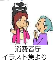
消費者庁 イラスト集より