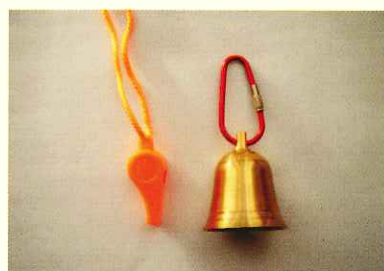
クマがいそうな場所や、やぶで見通しの悪い場所では、鈴やホイッスルを鳴らそう。