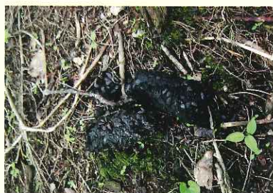
クマのフンや足跡を見つけたら、近くにクマがいるかもしれない。