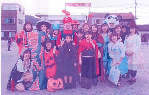
ファミリー劇場の催しハロウィン

子育て支援や文化的地域づくりを目的とした活動をしています。夢見るような、わくわくする、人と人がふれあえるような暖かな交流・体験ができたらと願っています。