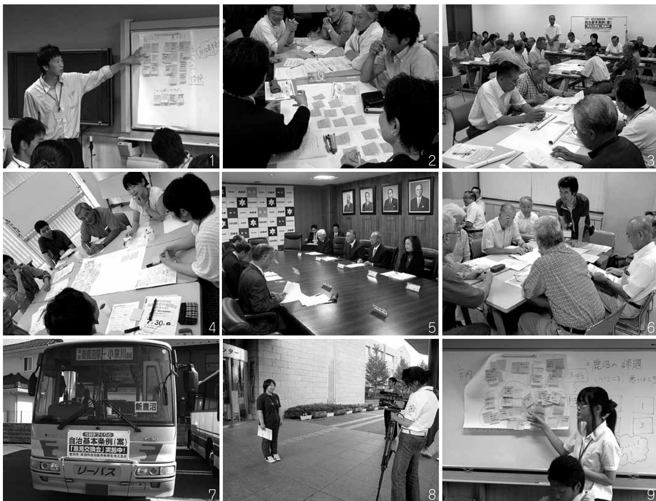
1・9 高校生や中学生からも意見をいただきました。 2・3・4・6 市民のみなさんとの意見交換会 5 市長への中間報告 7 リーバスでもPR! 8 鹿沼ケーブルテレビでPR番組を放映

平成21年11月から『鹿沼市自治基本条例を考える会』が進めてきた、「鹿沼市自治基本条例案」がまとまりました。