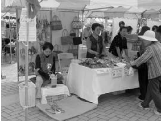
▲手作りの「布ぞうり」、「クラフトバッグ」が好評です。