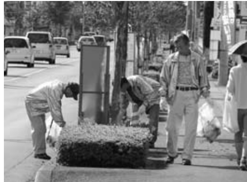
▲地域社会へ感謝を込めて奉仕活動を行なっています。

センター会員として活動し、 高齢者にふさわしい適度な仕事をする事は、 社会参加や健康を維持することにつながります。