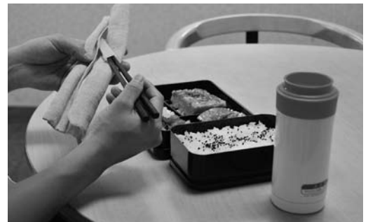
▲お弁当と一緒にマイ箸・マイボトルを