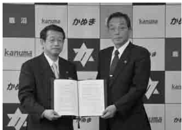
▲5月14日、共同発行に関する協定書の調印式を行いました。

37,000部作成し、3年間の保存版となる予定で、市内全世帯へ無料配布するとともに、転入者にも提供します。