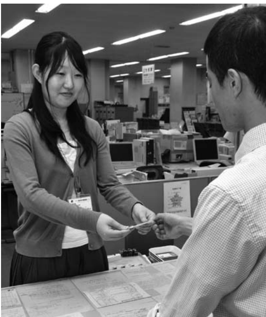
本人確認にご協力ください