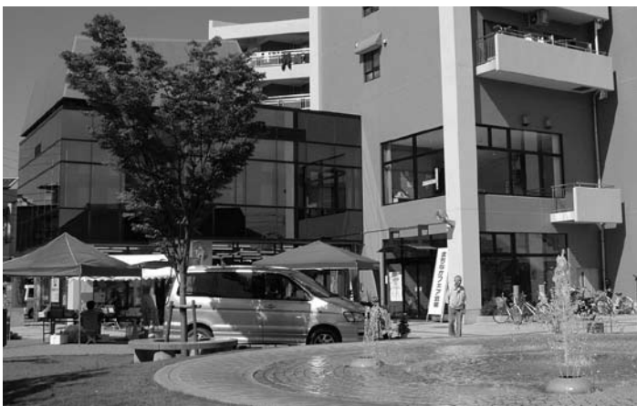
▲まちなか交流プラザは、憩いの場として親しまれています。