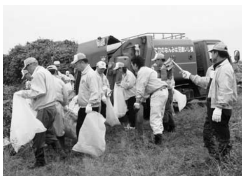
▲推進員一斉清掃の様子(黒川河川敷)