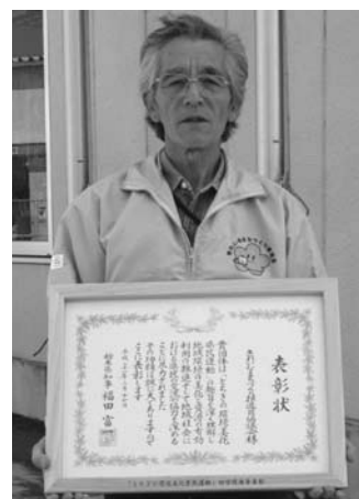
▲平成20年度のきれいなまちづくり推進員協議会の活動が、とちぎの環境美化県民運動、で表彰を受けました。