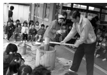
収穫したお米でもちつき!