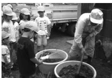
農家の人から苗作りを教わりました。