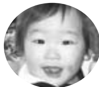
西茂呂3丁目 吉高神青空くん (H20.2. 8生)