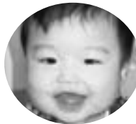
武子 大塚 優翔くん (H20.2. 6生)