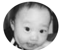
下武子町 長谷川颯哉くん (H20.2.11生)