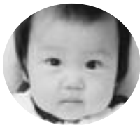
千渡 八木澤晟羽くん (H20.2.15生)