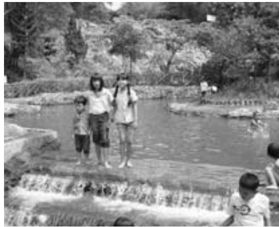
▲温泉公園では、服を着たまま温泉を楽しみます。

ふるさとほどのがんごなまちがなにか？ 私のふるさとの西ジャワ地区には、首都ジャカルタや学園都市バンドゥンなどの大きな都市があります。 郊外へ足を伸ばすと、豊かな自然が広がっています。バンドゥンから車で1時間ほどのところには、ジャワ島最大級の火山タンクバン・プラフ山がそびえ、近くのチアトルというまちには、温泉があります。