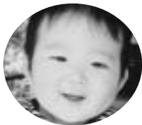
下武子町 大橋 奏くん (H20.2.12生)