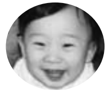
緑町2丁目 町田 藍希くん (H20.2.20生)