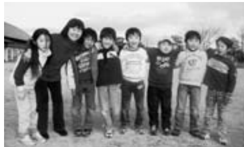
▲屋外活動(ワクワクおもしろ教室)