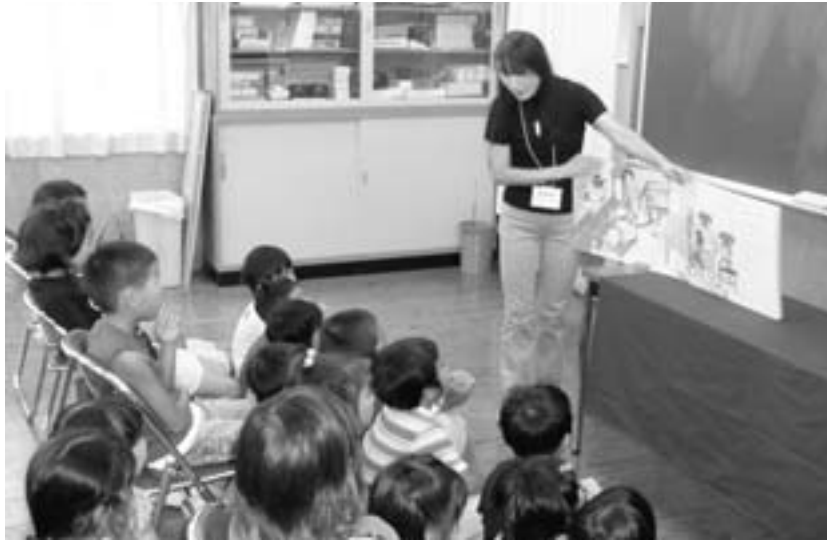
▲読みきかせ(北光クラブ)

放課後子ども教室をご存知ですか？ 鹿沼市では、平成19年12月から6教室開設しています。 保護者のみなさん、お子さんを連れて放課後子ども教室を一度のぞいてみませんか。