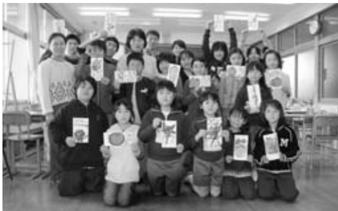
▲この日制作した絵手紙を手にポーズ！