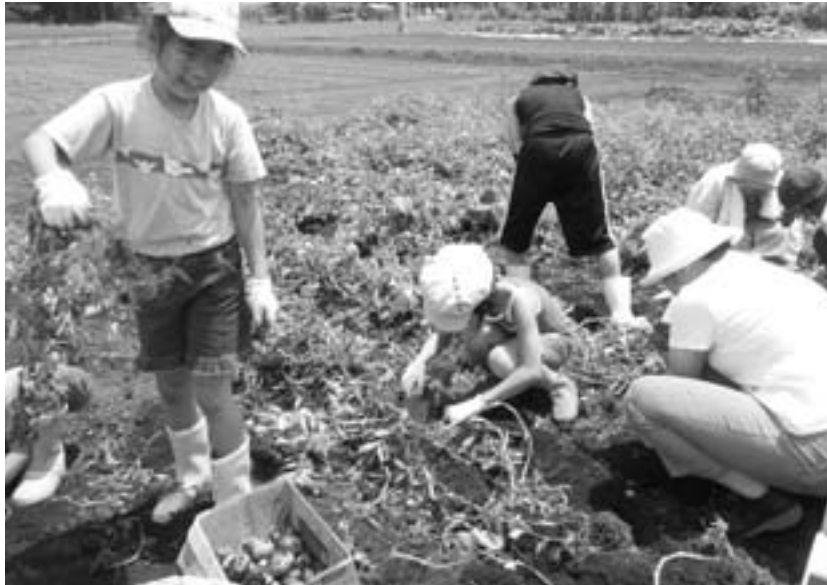
▲農業体験(学びステーション鹿沼)