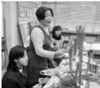
▲フラワーアレンジメント (スマイルルーム)