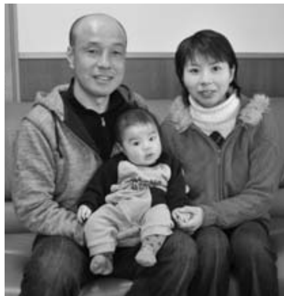
▲長男の悠太くんと3人で

お二人は、歌手の松山千春のファンクラブの会員で、その会報を通して知り合いました。今でも松山千春の大ファンで、昨年5月に宇都宮市で行われたコンサートにも行きました。