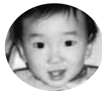
日吉町 井戸 佑くん (H19.12.17生)