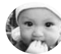
栄町1丁目 鶴野 拓光くん (H19.12.28生)