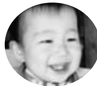
坂田山4丁目 郡司 和真くん (H19.12. 6生)