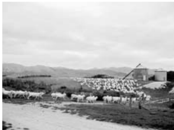
▲広々とした農場で羊たちものびのびと育ちます

ふるさとティマルは、美しい海と広大な山々に囲まれた自然の豊かなところです。私の実家は牧場を営んでいて、牛60頭、羊3,000頭を育てています。子どもの頃は、800エーカー(約324ヘクタール)もある広大な農場で家族の手伝いをしたりして、過(やりすぎ)していました。