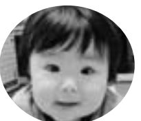
上野町 星野 煌月くん (H19.12. 5生)