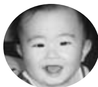
幸町1丁目 鹿目真一郎くん (H19.11.20生)