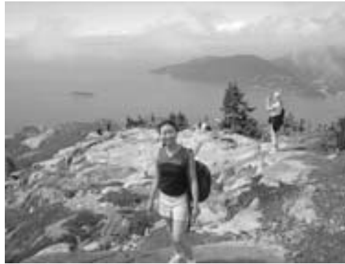
▲バンクーバー市郊外のブラックマウンテン山頂

ふるさとほどこのように美しい場所はない。バンクーバー市は、美しい海と広大な山々に囲まれた自然豊かな都市です。また、様々な人種の人々が、互いを認め合って暮らす住みやすいまちです。 休日は、ハイキングやカヤックなど自然の中で楽しむことが多いです。ウィンタースポーツも盛んで、2010年には冬季オリンピックが開催されます。