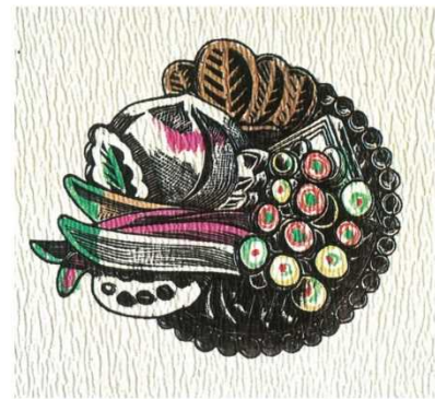
川上澄生《静物（菓物の菓子）》（部分）1926（大正15）年頃 木版墨刷 手彩色 紙 10.6×12.3cm

お問い合わせ：川上澄生美術館 0289-62-8272 http://kawakamisumio-bijutsukan.jp