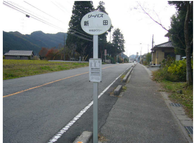
この写真は、コマ図の何番にあるでしょう？ (答え ⑯ or ⑰ )