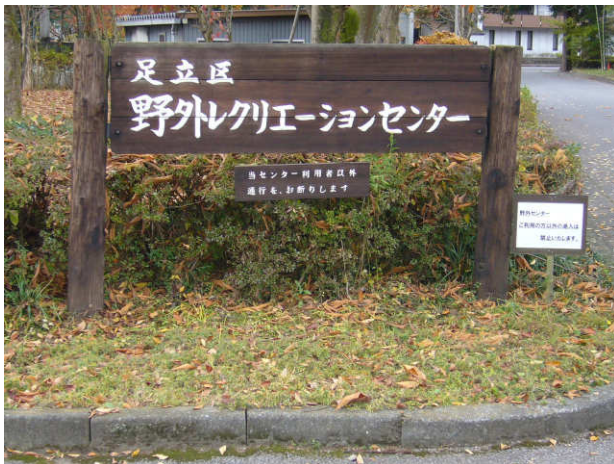
この写真は、コマ図の何番にあるでしょう？ (答え ⑲ )