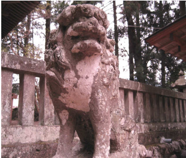
この写真は、コマ図の何番にあるでしょう？ (答え ⑩ or ⑪ )