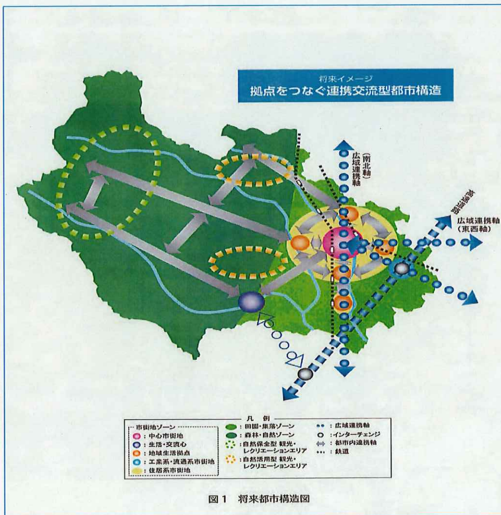
鹿沼市都市計画マスタープランより

本計画に基づき形成する地域公共交通網は、第7次総合計画及び都市計画マスタープラン等に示されるまちづくりの実現に貢献できるものとし、少子・高齢化、人口減少社会に適應するため、地域拠点を結ぶ公共交通ネットワークを構築し、コンパクトシティの実現に取り組みます。