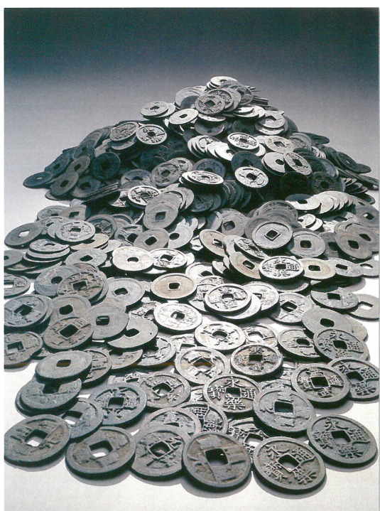
茂呂城跡付近出土の古銭

今回の企画展は、文化課文化財係が近年、収集・調査した資料を中心に展示し、鹿沼の歴史や文化の新たな一面を紹介するものです。