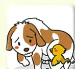
ワンワンものがたり