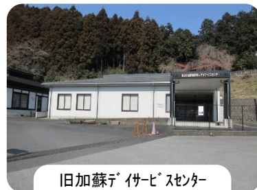
旧加蘇デイサービスセンター