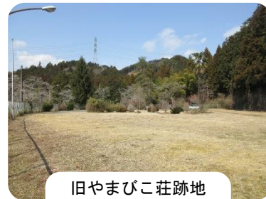
旧やまびこ荘跡地