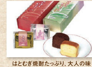
美たまるかすたら Bitamaru Castilla