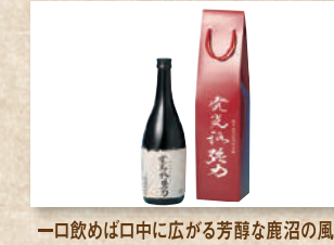
純米吟醸酒発光路強力 Junmai Ginjo Shu "Hokkoji Goriki"