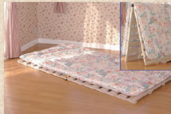
布団干し機能付きすのこベッド Duckboard Beds with Futon Drying Function

日本で初めての布団干しができるすのこベッド。栃木県産の安全安心のヒノキを使い、各大手通販でも販売ランキング上位を獲得する大人気商品。数多くの特許・実用新案も取得したアイデア商品です。