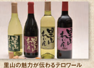
かめま里山ワイン Kanuma Satoyama Wines