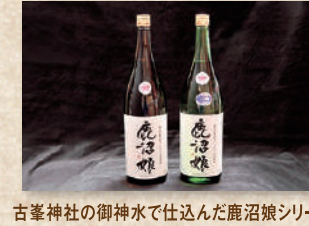
鹿沼娘シリーズ Kanumamusume Series