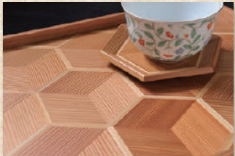
鹿沼寄木 Kanuma Yosegi (marquetry)

木工のまち鹿沼で生まれた杉寄木細工の技。鹿沼寄木細工は建具に使う柃目材を菱形に加工し、立体模様に見えるよう組み合わせ合わせた、軽くて使いやすい寄木製品です。