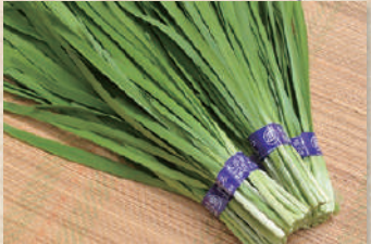
にら Chinese Leeks

スタミナ野菜の代表生産量・品質ともに全国トップクラスの鹿沼にら。太く肉厚であり、深みのある香りと甘みは別格です。