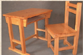
木製学習机・椅子 Wooden Study Desks and Chairs

木の温もりを楽しむ木製学習机・椅子セット。栃木県産ヒノキの選伐材(間伐材)を使用した、環境にやさしい商品。木製ならではの温かぬくもりと肌ざわりを、シンプルなデザインで楽しめます。