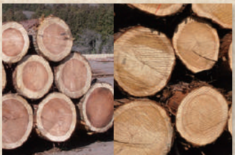
鹿沼のスキ材・ヒノキ材 Kanuma Lumber of Cedar and Cypress

柔らかい風合いと確かな強さ。時間をかけてまっすぐ育つ鹿沼のスキ・ヒノキは、光沢がよく強度にも優れ、その品質は、鹿沼の気候、地質、人の技術によって守られています。