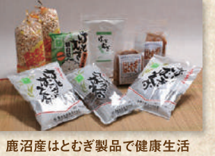
はとむぎ製品 Adlay Products