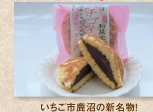
鹿沼イチゴイチエ Kanuma Ichigo Ichie