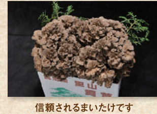
里山まいたけ Satoyama Maitake Mushroom