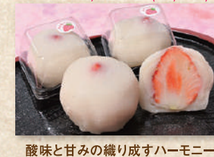
いちご大福(光陽堂) Strawberry Daifuku (Koyodo)