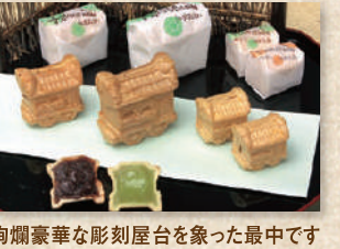
元祖屋台最中 Ganso Yatai Monaka