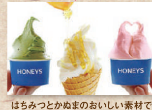
ハニーゼラート Honey Gelato