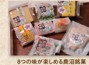
統一銘菓 泣き相撲シリーズ Toitsu Meika Naki-Zumo Series