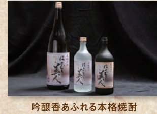
本格はとむぎ焼酎 はとむぎ美人 Honkaku Hatomugi Shochu "Hatomugi Bijin"