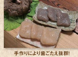
鹿沼こんにやく Kanuma Konjac