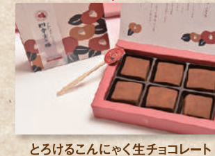
生ちょこんにやく 四季実の種 Nama-Choco-Konjac "Shiki Mi no Tane"