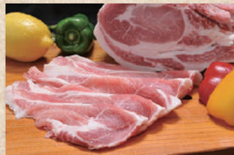
さつきポーク Satsuki Pork

美味しさの秘密は素材の良さ。「うまい豚肉」を生産するため、厳選した単味原料を使用し、飼料製造管理者(農水認定)のもと、自家配合を実施しています。