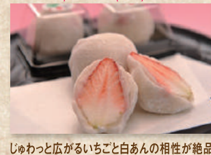
いちご大福(錦京堂本店) Strawberry Daifuku (Kinkyodo Honten)