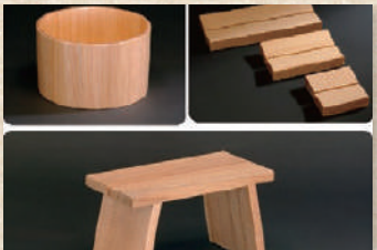
New KANUMAシリーズ New Kanuma Series

鹿沼の歴史から新たなデザインを「典型」をデザインコンセプトに開発された、新たな家具・雑貨の商品群。物の本質をとらえた新たなロングライフデザインの本流を目指します。