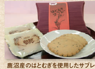
はとむぎサブレ Adlay Sable