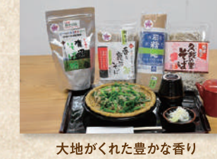
鹿沼そば Kanuma Soba Noodles