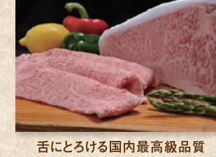
かめま和牛 Kanuma Wagyu Beef