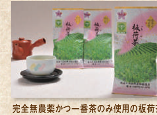
板荷茶 Itaga-cha Tea