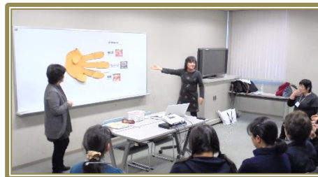
鹿沼市手話奉仕員養成講座