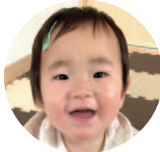
下沢 高村 彩心ちゃん (H31.4.12生)