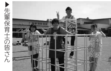
▶先輩保育士の皆さん