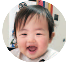
上材木町 高橋 佳樹くん (H31.4.15生)