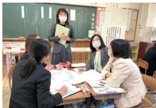
▲授業力向上研修会の様子

この研修会は、よりよい授業を行うことを目的として、教師を対象に行うもので、教科ごとに指定されたモデル校における授業の公開や、アドバイザーである大学教授からの指導、助言、意見交換などを行っています。