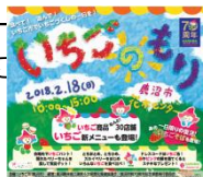
例) イベント「いちごのもり」

市は「いちご市」を宣言し、知名度向上のために様々な事業を通して、市内はもとより全国・世界に「いちご市」をアピールします。特にシティプロモーション事業に「いちご市」が連携のお声掛けいたします。