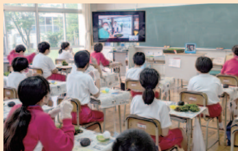
▲オンラインでの苔玉作り体験

コミュニティ・スクールではこれまで行ってきた活動を大切にしながら、地域と共に学びを進めています。