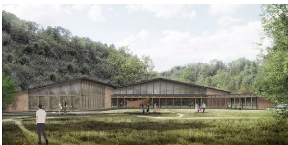
温泉と農村レストランが入る建物のイメージ