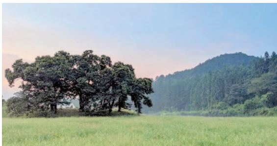
キャンプ場予定地

市は、南摩ダムより水道用水の供給を受ける自治体等*の補助事業を活用して、上南摩町に市西北部地域の振興拠点となる施設を整備しています。開業は、令和6(2024)年4月の予定です。