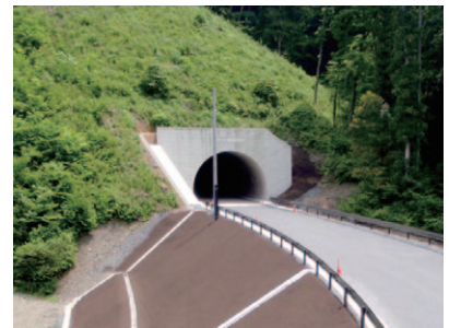
にしぐささ 西口笹トンネル