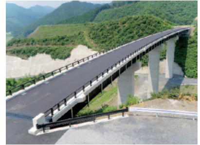
きずなおほし 絆大橋