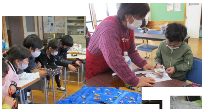
放課後子ども教室：工作・昔遊び他