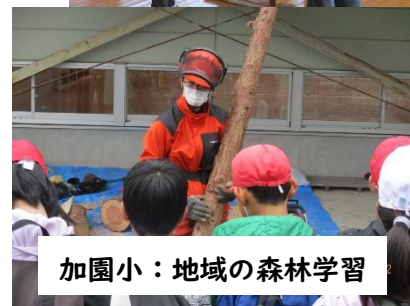
加園小：地域の森林学習