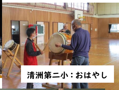
清洲第二小：おはやし