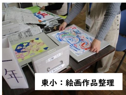
東小：絵画作品整理