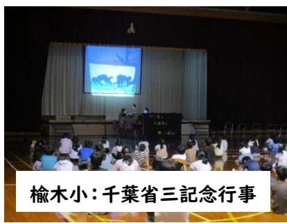
楡木小：千葉県三記念行事