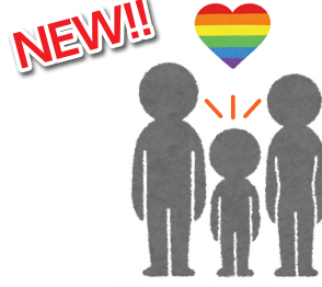
パートナー&ファミリーシップ宣誓制度