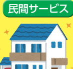
NEW!! 民間サービス 住宅ローンの 申し込み

※個人情報の開示請求の代理につきましては、カップルまたは実子もしくは養子縁組の関係にある場合が該当となりますので、ご注意ください。