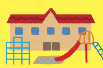
NEW!! 保育所等 入所申請