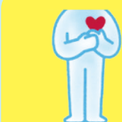
NEW!! 犯罪被害者等 支援