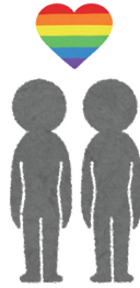
パートナーシップ宣誓制度

本市では、令和元年6月3日、同性カップルに対し行政がバックアップする「鹿沼市パートナーシップ宣誓制度」がスタートしました。そして令和4年4月1日、同性カップルにとっても妊娠や子育ては選択肢の一つであることから、「鹿沼市パートナー&ファミリーシップ宣誓制度」として拡充しました。