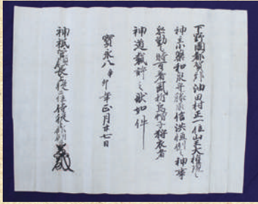
▲宝永8（1711）年に 出された神官の免許状

昨年の七月、油田町に残された古文書の整理が始まりました。整理をするのは、市民学芸員の皆さんです。一〇〇年以上の間、閉じられていた木箱の中からは、江戸時代の神主に関するたくさん古文書が出てきています。調査完了までまだ時間がかかりますが、成果は広く公開する予定です。ぜひご期待ください。