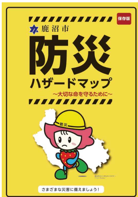
鹿沼市防災ハザードマップ_表紙