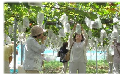
▲ぶどう狩りのようす

午前中は「いわふねフルーツパーク」でぶどう狩りを楽しみました。昼食は「レストラン リヴァージュ」でフランス料理をいただき、午後は