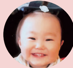
晃望台 高橋 凰太郎くん (R4.5.24生)