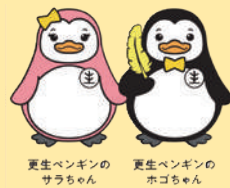
更生保護イメージキャラクター

犯罪や非行をした人達からの相談に乗ったり、助言を行うほか、それぞれの地域で犯罪や非行をした人の立ち直りや犯罪予防のための啓発活動を行っています。