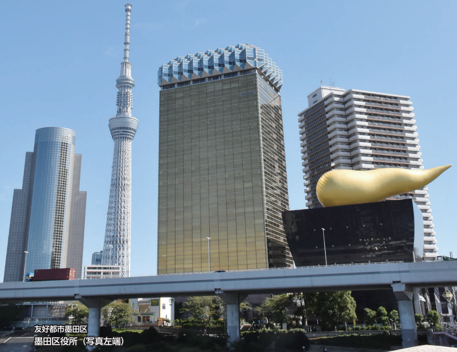
友好都市墨田区 墨田区役所（写真左端）

200年の歴史を歩き、新年の福を招く 隅田川七福神めぐり 「移動スーパー」好評運行中！ 高齢者福祉センター、高齢者・障害者トレーニングセンター（なごみ館）を ご利用ください 移住対策のためのモニタリングツアーを実施しました キラリ★女性活躍カンパニー 社会を明るくする運動 年末年始の業務案内