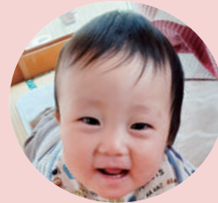
千渡 宮崎 吏翔くん (R4.5.12生)