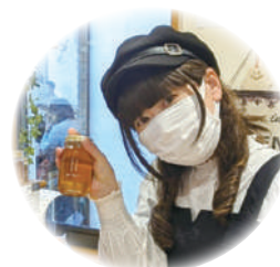
あいこさん 東京都在住 20代