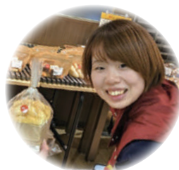
まいさん 東京都在住 20代