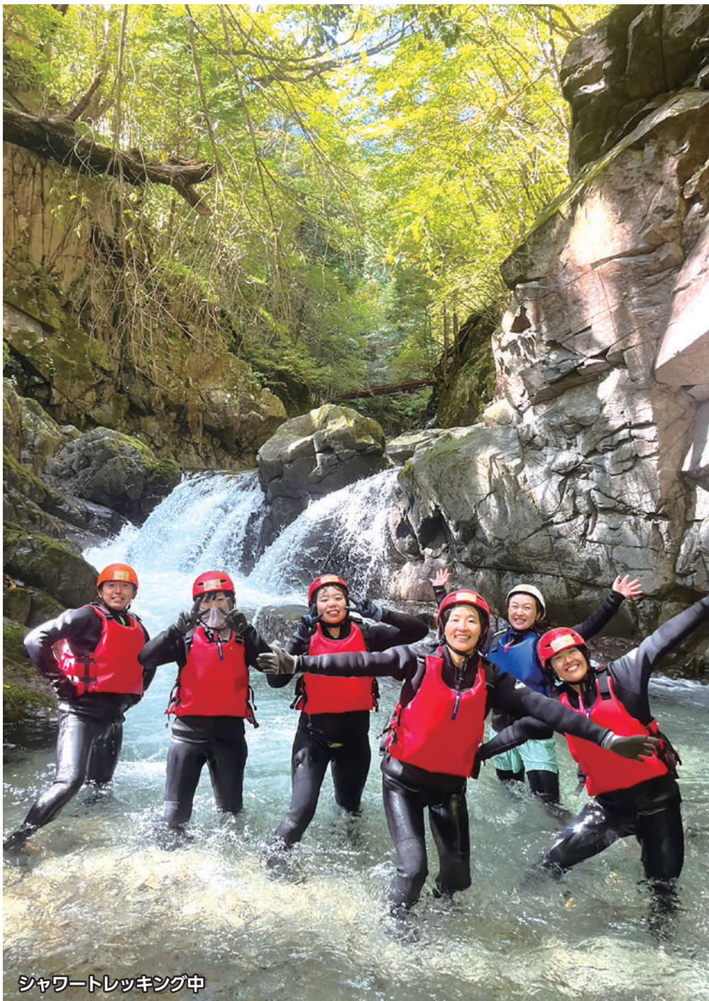
シャワートレッキング中