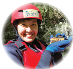
あおいさん 埼玉県在住 30代