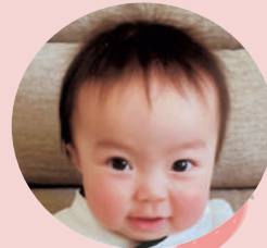
上日向 川田 真生くん (R4.5.27生)