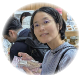
あやさん 千葉県在住 40代