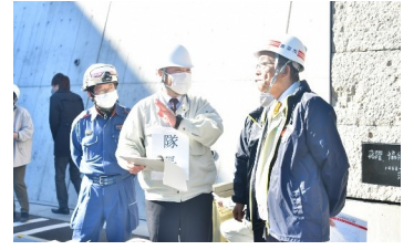
3/1~7 「春季全国火災予防運動」