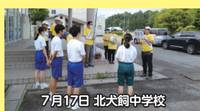
7月17日 北犬飼中学校