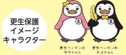
更生保護イメージキャラクター

犯罪や非行をした人達からの相談に乗ったり、助言を行うほか、それぞれの地域で犯罪や非行をした人の立ち直りや犯罪予防のための啓発活動を行っています。