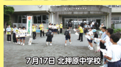
7月17日 北押原中学校