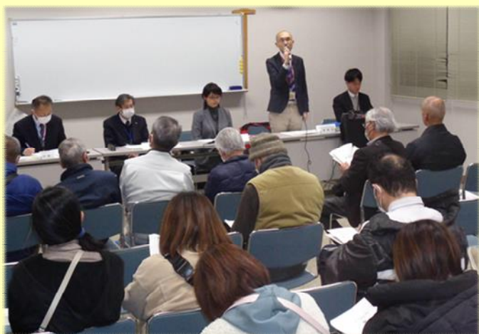
▲学校再編の説明に熱心に聴き入りました

今後設置される「開校準備会」では、引き続き保護者や地域の意見を踏まえた学校再編が進められることが期待されます。