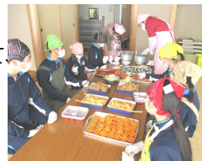
盛り付けのようす♪