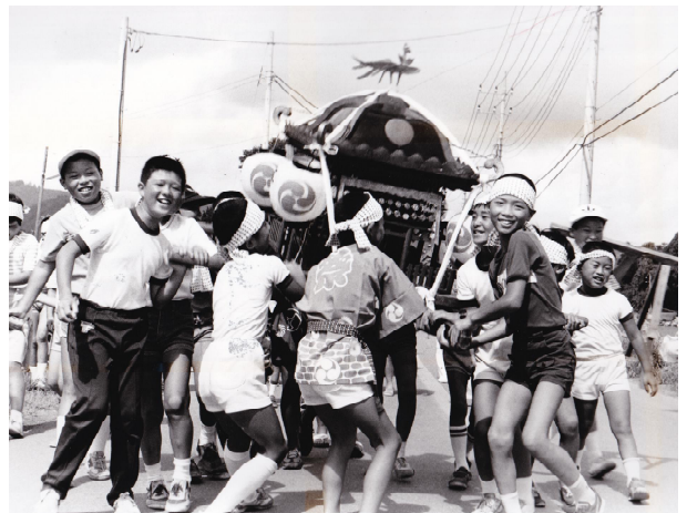
▲みこしを担ぐ子どもたち（昭和59年8月号）

「十三夜のわら鉄砲 大麦・小麦 大豆も小豆もよくあたれ 三角畑のそばあたれ」と唱和してわら鉄砲を地面に打ちつける。豊作を祈願し行われた。口粟野上仲町にて。