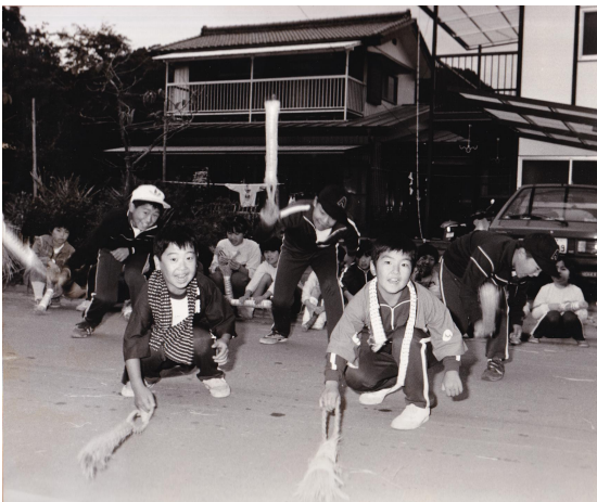
▲わら鉄砲を打つ子どもたち（昭和59年10月号）

場所は粟野第二小学校。町人口は昭和49年2月1日現在において、11,541人（男5,626人、女5,915人）を数えた。