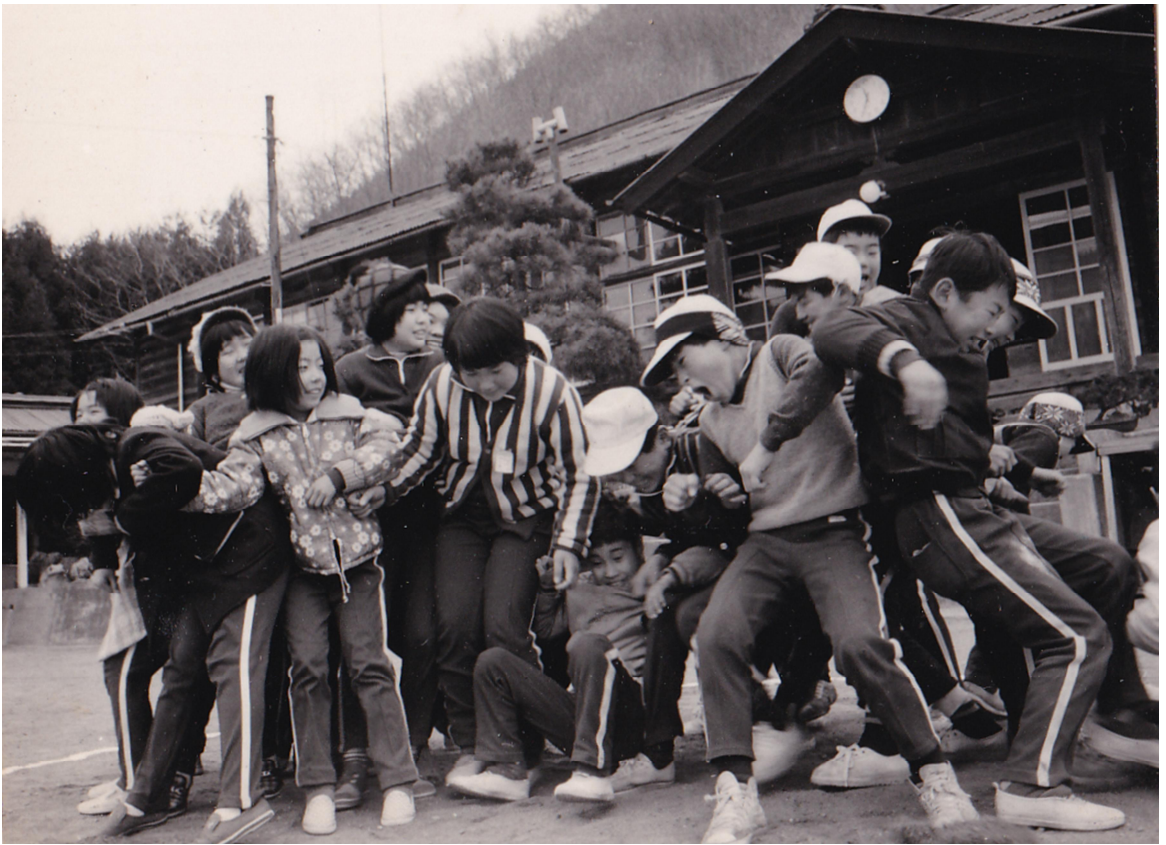
▲おしくらまんじゅうする子どもたち（昭和49年2月号）。

場所は粟野第二小学校。町人口は昭和49年2月1日現在において、11,541人（男5,626人、女5,915人）を数えた。