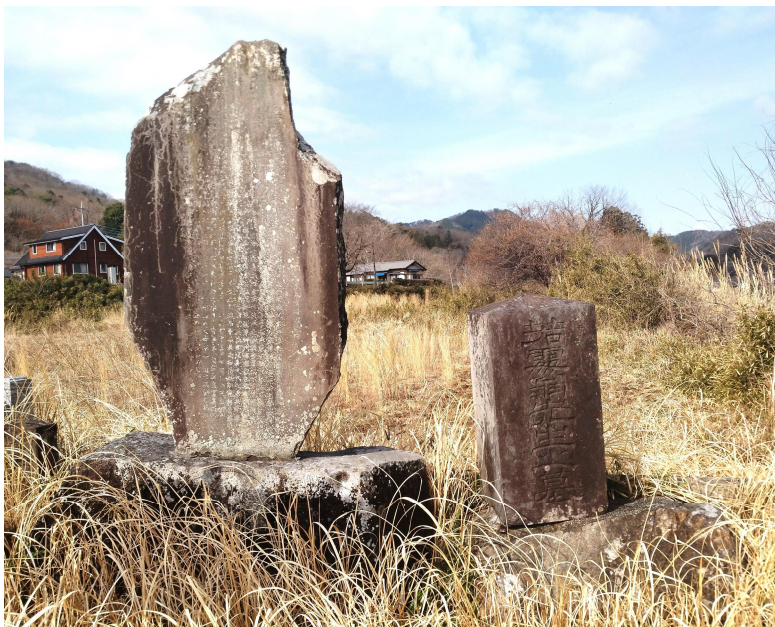
▲中條若処の墓（深程）