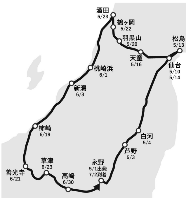
▲池澤榎好の旅のルート