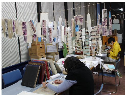
▲清洲第一小学校所蔵資料レスキュー作業

令和元年（二〇一九）一〇月、栃木県に大きな台風が襲来しました（令和元年東日本台風）。台風は、関東甲信地方と東北地方を中心に記録的な大雨を降らせ、鹿沼市内も大きな被害を受けました。このとき、一階部分が浸水した清洲第一小学校では、校長室に保管されていた古い記録が泥水に濡