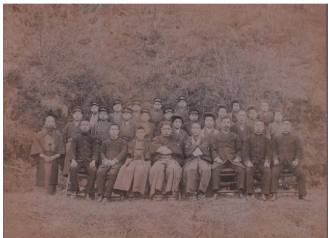
▲卒業記念集合写真

地方史研究協議会編『学校資料の未来―地域資料としての保存と活用―』岩田書院、二〇一九年