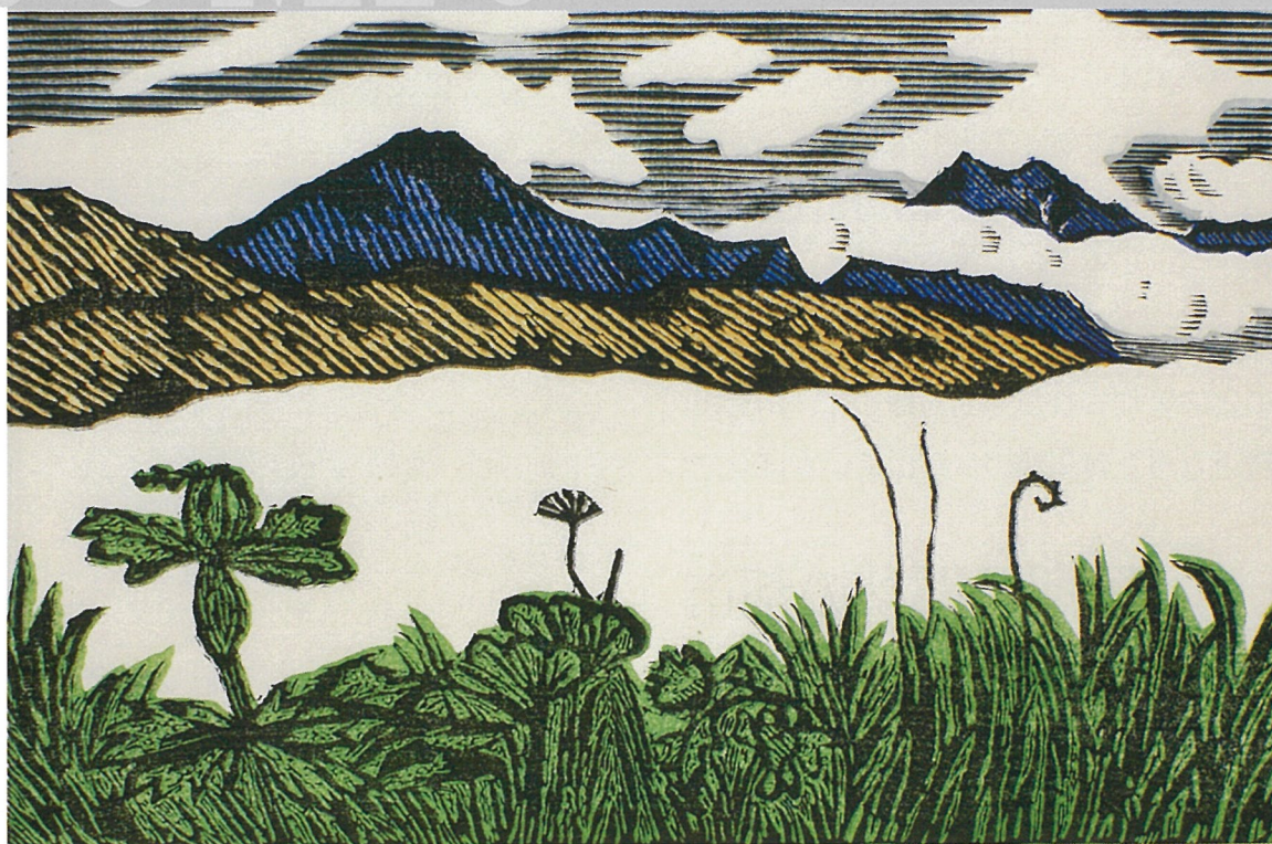
川上澄生《渚辺の草原》1966（昭和41）年『アラスカ物語』（1966年）挿画 [I期展示]