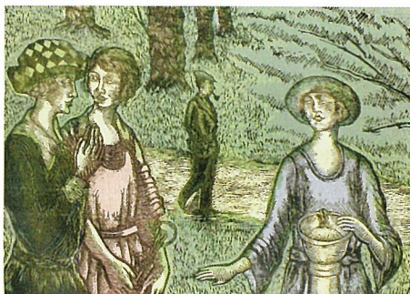
川上澄生《異国春光》1924 (大正13)年 [I期展示]

本展では、文明開化の時代の都市や横浜をモチーフにした作品を展観し、川上澄生が描いた郷愁の都市の姿をご覧ください。