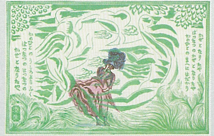
川上澄生《初夏の風》1926 (大正15)年