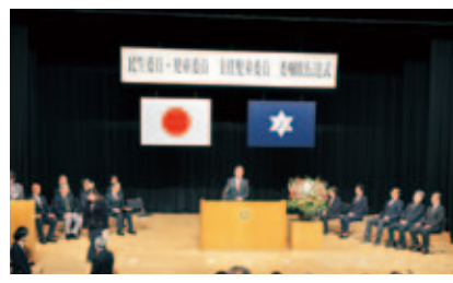
◀ 昨年12月の委嘱状伝達式