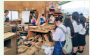
▲廃材を活用した木工品店の見学

② 地域のための「実践」… 毎年恒例となった「やんぐ祭」で、地域の魅力が詰まったカルタ大会や鹿沼産材を使ったオリジナルモルック体験などを実施しました。