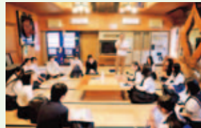
▲鹿沼や古峯神社の歴史を学ぶ

① 地域の魅力を知る活動…地域の皆様のご協力と普段の生活では触れられない魅力を体感できました。