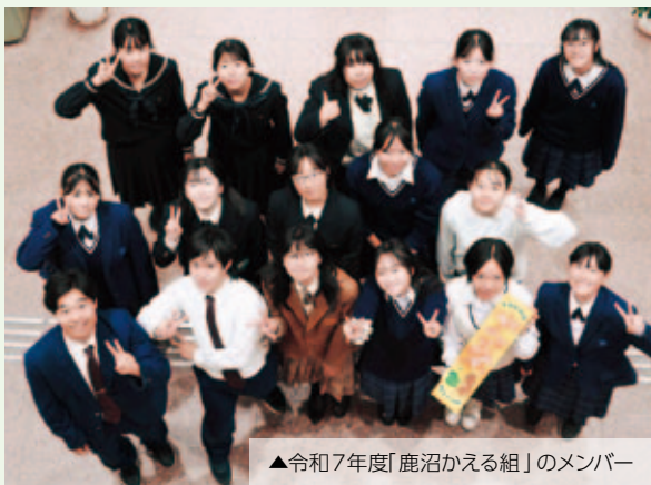
▲令和7年度「鹿沼かえる組」のメンバー