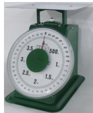
ばね式指示はかり