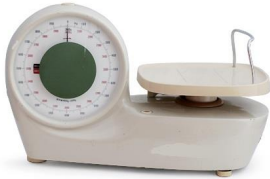
ばね式指示はかり