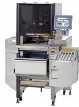
(ラップ包装付) 電気式はかり