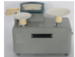
手動指示併用はかり ※分銅付き