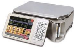
(ラベル印刷可) 電気式はかり

○スーパーマーケット、一般小売店(食料品、鮮魚、精肉、青果、米穀等)、宅配便取次店、農産物直売所、各種製造業、金物店、雑貨店等