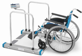
<車椅子体重計> 電気式はかり