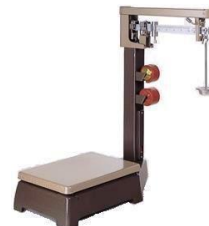
台はかり ※定量増おもり付き