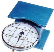
<体重計> ばね式指示はかり