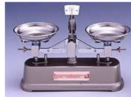
等比皿はかり ※分銅付き