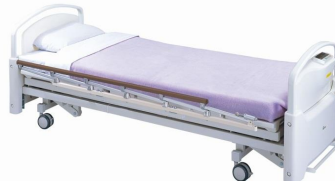
<ベッドスケール> 電気式はかり