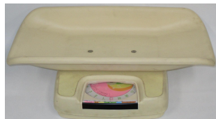
<ベビースケール> ばね式指示はかり