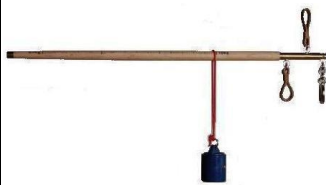
棒はかり ※定量増おもり付き