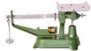
不等比皿はかり ※定量増おもり付き