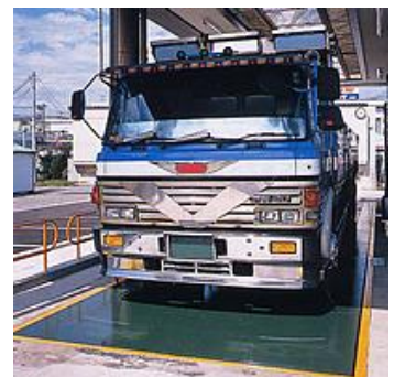
<トラックスケール> 電気式はかり