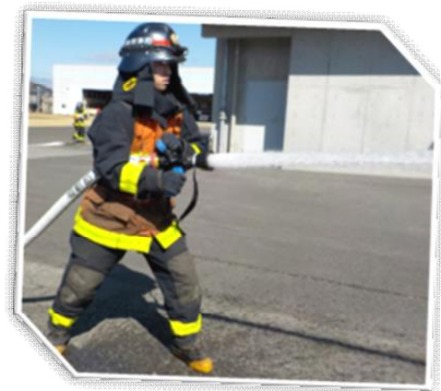
消防本部 消防署 消防第1課 消防第1係